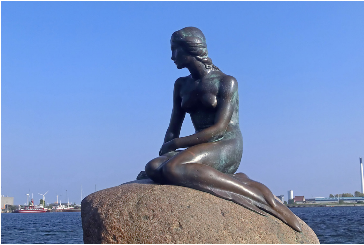
Statua che rappresenta la Sirenetta di Hans Christian Andersen, situata all'ingresso del porto di Copenaghen