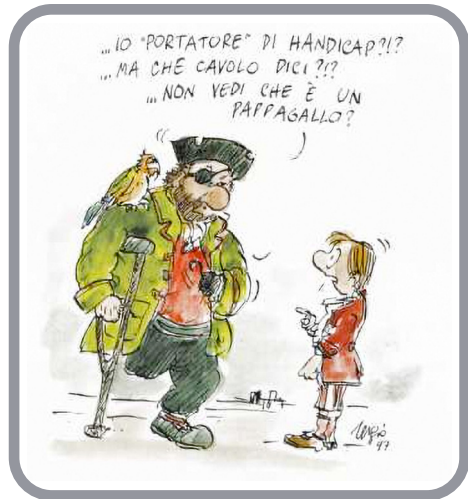
Vignetta di Staino su linguaggio e disabilità (da DM rivista della Unione Italiana Lotta alla Distrofia Muscolare)

E ci raccomanda di fare attenzione con le parole: quindi NON “disabile”, “portatore di handicap”, “invalido” o “diversamente abile”, espressione vaga e imbarazzata, ma semplicemente: “persona con disabilità”. L’attenzione sta lì, sulla persona. La sua condizione, se proprio serve esprimerla, viene dopo. La persona (il bambino, la ragazza, l’atleta ecc.) al primo posto.